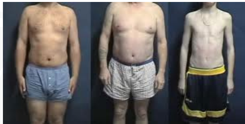
Klein en dun

Op verzoek nog de Leptocheck (detecteert IgM-antistoffen tegen leptospirose) gedaan: